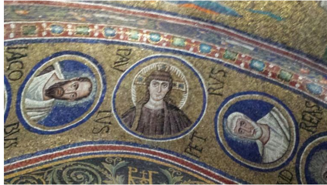
Oratorium S. Andrea Ravenna, 5. Jh.